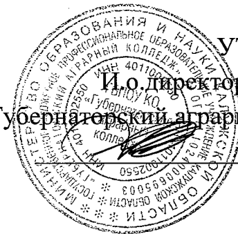
График учебного процесса заочной формы обучения ГБПОУ КО «Губернаторский аграрный колледж»

специальности 35.02.08 «Электрификация и автоматизация сельского хозяйства»